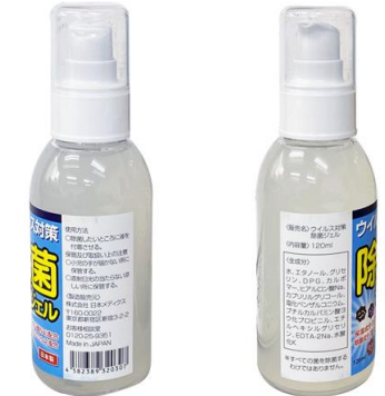
② 携帯用手指消毒液